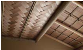
平天井は、迫力ある網代天井。廻縁には、こぶしを使用。また、掛込天井には、黒部杉へぎ板、垂木は磨き丸太と小竹を使用している。