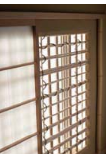
にじり口の上に設えた下地窓。薩摩葎(さつまよし)を格子状に組み、あけび蔓(つる)で纏んだ軽妙な窓の意匠は室内に変化をもたらす。今では施工できる職人も少ない。