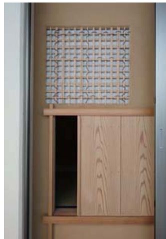
バルコニー側から見たにじり口。仕上げは杉無垢板うすくり、マンションサッシの内側に設えたとは思えない完成度である。