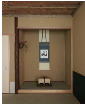
本格的な千家流の床構え。床柱は皮付赤松、床框は杉の磨き丸太を使用。リビングからも見えるよう、隣接して計画した。

その甲斐があってオーナー様には完成度の高いディテールにご満足いただき、奥様からは、茶の湯のお稽古にさらに励みたいという嬉しいお言葉をいただいています。