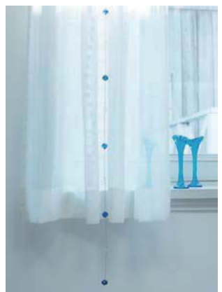
水玉柄の透けるカーテンに組み合わせたブルーのカーテンドロップ。窓辺でこそ、こんなビーズのきらめきを生かしたいもの。

一枚のドレスをアクセサリで何通りにも楽しむように、カーテンも、アクセサリ次第で、その楽しみ方がぐんと広がってきたようです。