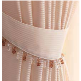
横ストライプの透ける生地を使ったルースシェード。カーテンを引き上げたときに生まれるふっくらした装の裾をビーズのついたりボンコードでトリミング、日中の窓辺を楽しく彩ります。(写真上) 脇のタッセルにも、ビーズのトリミングでさりげないアクセントを。(写真下)